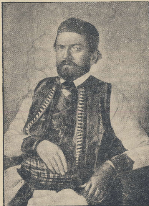
Petar II Petrović-Njegoš (vladika Rade)

Pojava Ante Starčevića ne znači drugo, nego podizanje jedne snažne i glasne riječi probuđenog, a ugroženog hrvatskog nacionalizma; riječi, koja ima kao živa